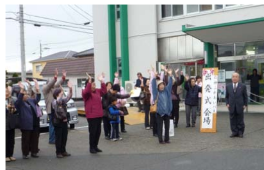
「応神ふれあいバス」出発式典(平成23年12月3日)