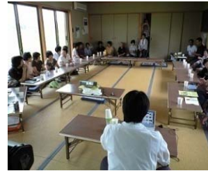
有識者を招いての先進事例学習