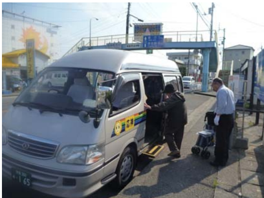
運転者が利用者の乗降を手助け