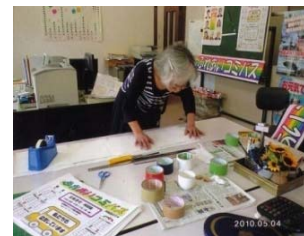
手作りの時刻表やポスター