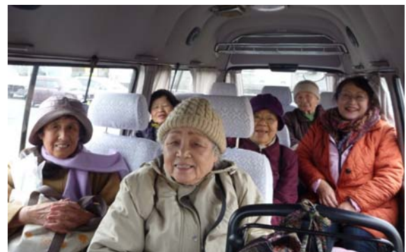
バス車内は地域の寄合サロン