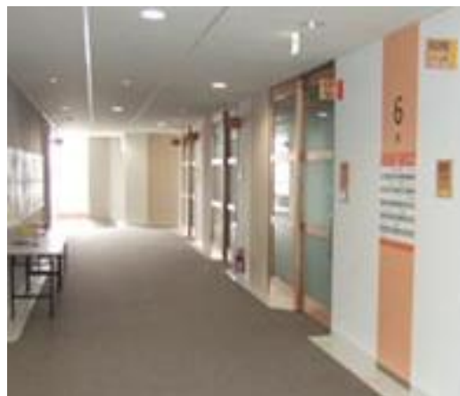
図 2 神奈川工科大学