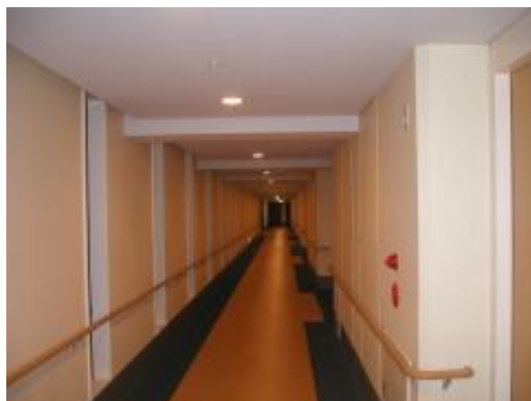
図 1. 国際障害者交流センタービッグアイ

視覚障害者誘導用ブロックは, その有用性が世界的に評価されている反面, それを必要としない人にとっては突起が余計なバリアとなりうることも指摘されている. これに対し近年, 感触の異なる2種類の床仕上げ材を用いて視覚障害者を誘導するという試みが複数の施設において行われている (図1. 2). 本研究では, ①このような施設で敷設される床仕上げ材に, 視覚障害者が沿って正確に歩ける性能があるかを評価し (本研究ではこのような性能を“誘導性能”と記す), ②その誘導性能に床仕上げ材のどのような性質が関係するのかを明らかにすることを目的とする. なお2種類の床仕上げ材に沿って歩行するためには, 2種類の床仕上げ材の境界部を正確に把握する事が重要である. また正確に境界部を把握するためには, 白杖を使用して探索することが重要であることから白杖の感覚に着目して研究を行った.