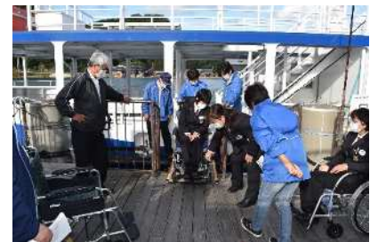
(社内研修の様子/旅客船)