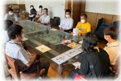
えか ようす ▲お絵描き※クイズの様子

こうぎ じかん しんけん はなし き 講義の時間は、みんな真剣に話を聞いてくれます。 じつぎ たの じゅうごうせい わら 実技は楽しくやってほしいです。受講生が笑ってくれるとうれしいです。 けんしゅう さんか きんちよう え か 研修に参加すると緊張していたけど、お絵描きクイズをはじめてから たの 楽しくなりました。