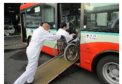
(社内研修の様子/路線バス)