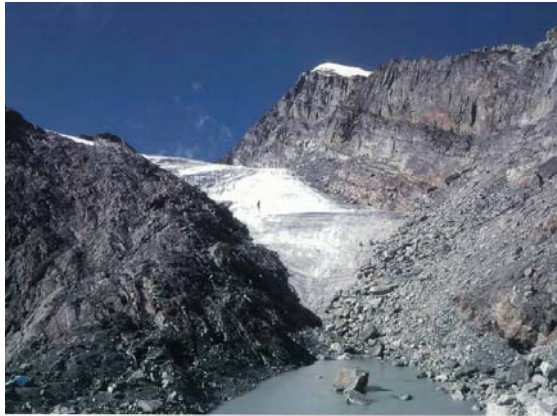
後退するヒマラヤの氷河