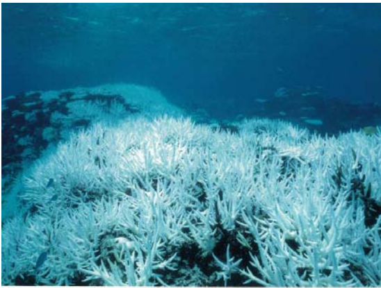
死滅するさんご礁