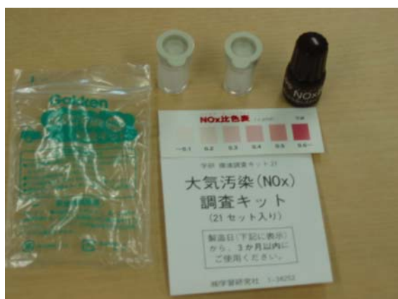
大気汚染(NOx)調査キットの例