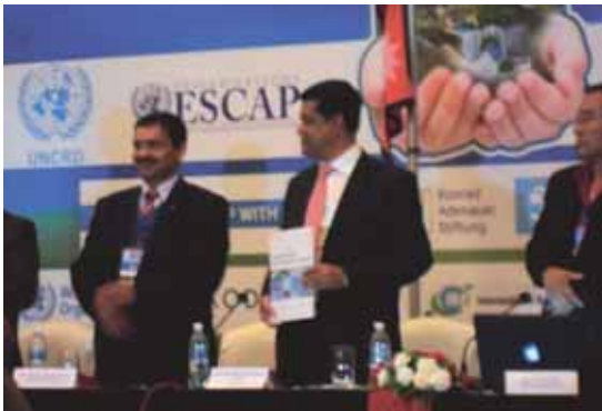
全体会合4 (TEJ2015 紹介)

平成27年11月18日～20日にかけて、ネパール・カトマンズにて第9回アジアEST地域フォーラムが開催されました。当財団から熊井課長代理が参加し、全体会合4「バンコク2020年宣言の実行による各国の主な課題、進展と功績—愛知(2005)からカトマンズ(2015)への移行」において、当財団発行のTEJ