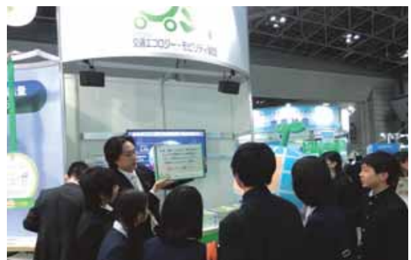
当財団の出展風景

(エコプロダクツ2015の実績・出展:702社・団体、来場者数:約17万人、当財団ブースへの来訪者数実績・約4,000名)