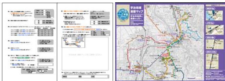
▲使用した「アンケート調査票」と「通勤マップ」