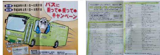
(キャンペーンと対象店舗周知用のポスターと店舗掲示用のステッカー 北紋バスより)