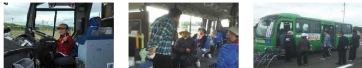
(平成29年8月27日開催「ふれあい広場inもんべつ 2017」(実施主体:紋別市社会福祉協議会)参加の様子 北紋バスより)