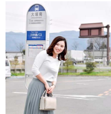
パンフレットの自社モデルにも