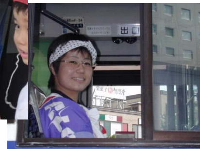
びんずる祭りのコスチュームで