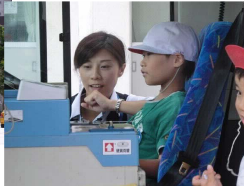
小学生のバス乗り方教室で、優しくレクチャー