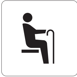
高齢者優先席 Priority seats for elderly people