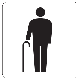
高齢者優先設備 Priority facilities for elderly people

(備考) 「この部屋は気持ちを静めるため の部屋です」など、運用に適した利用説 明の表示をつけることが望ましい。