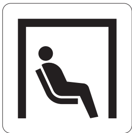
カームダウン・クールダウン Calm down, cool down

[注1] (文字による補助表示をつける場合は 「カームダウン・クールダウン」とする)