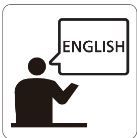
コミュニケーション Communication in the specified language