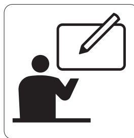
コミュニケーション：筆談対応 Communication : Writing