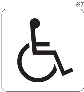
障害のある人が使える設備 Accessible facility