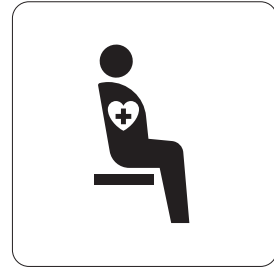
内部障害のある人優先席 Priority seats for people with internal disabilities, heart pacer, etc.