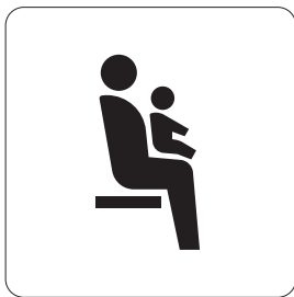
乳幼児連れ優先席 Priority seats for people accompanied with small children