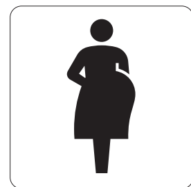
妊産婦優先設備 Priority facilities for expecting mothers