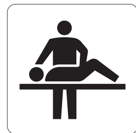
介助用ベッド Care bed