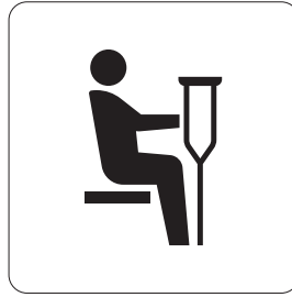
障害のある人・ けが人優先席 Priority seats for injured people