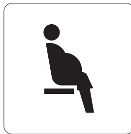
妊産婦優先席 Priority seats for expecting mothers