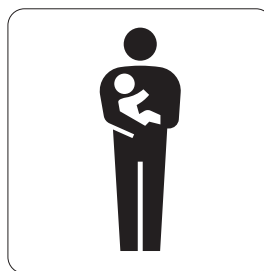
乳幼児連れ優先設備 Priority facilities for people accompanied with small children