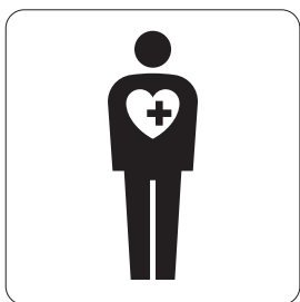
内部障害のある人優先設備 Priority facilities for people with internal disabilities, heart pacer, etc.