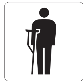
障害のある人・けが人優先設備 Priority facilities for injured people