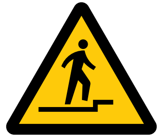
上り段差注意 Caution, uneven access / up