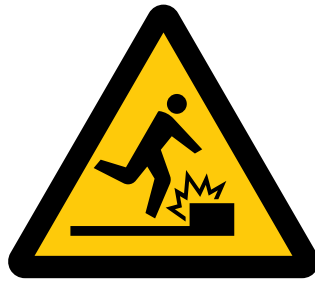
障害物注意 Caution, obstacles [注1] (文字による補助表示が必要)