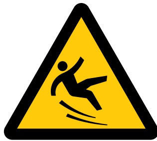
滑面注意 Caution, slippery surface