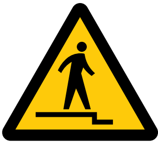
下り段差注意 Caution, uneven access / down