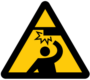
天井に注意 Caution, overhead