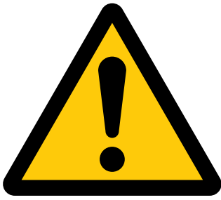
一般注意 General caution