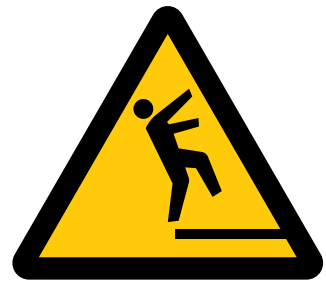
転落注意 Caution, drop [注1] (文字による補助表示が必要)