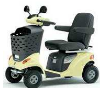
④ハンドル形電動車椅子