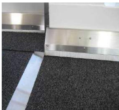
搭乗橋のつなぎ目部分の段差を解消