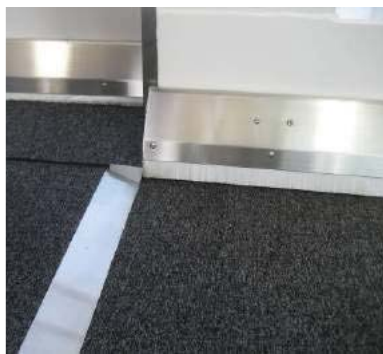
搭乗橋のつなぎ目部分の段差を解消