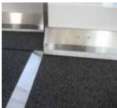
搭乗橋のつなぎ目部分の段差を解消