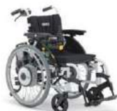
②簡易型折りたたみ式 電動車椅子