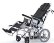
⑤座位変換型車椅子