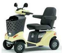
④ハンドル形電動車椅子