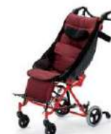
⑥子供用車椅子 （福祉バギー・バギーカー）