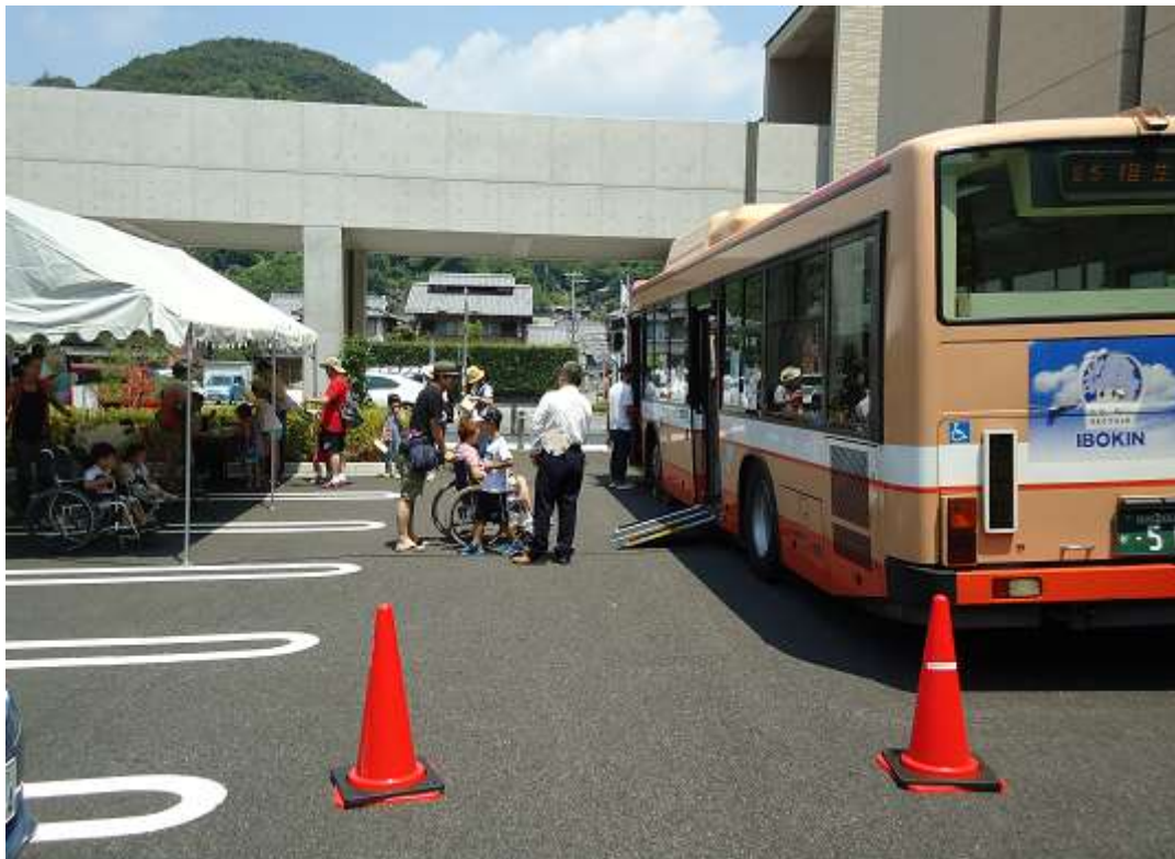
（当日の会場の様子）

参加者に、「交通バリアフリーからともに生きる社会を学ぼう！」と「交通バリアフリークリアファイル」を配布