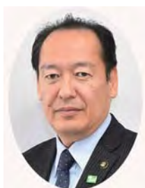
陸前高田市長 戸羽太氏