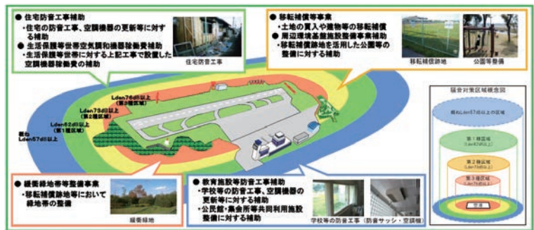
●空港周辺環境対策事業 概要図

なお、空港と周辺地域において、環境の保全及び良好な環境の創造に向け、エコエアポート・ガイドラインに基づき、空港において航空機用地上動力設備（GPU）の導入支援など環境負荷軽減に向けた取り組みを推進しています。