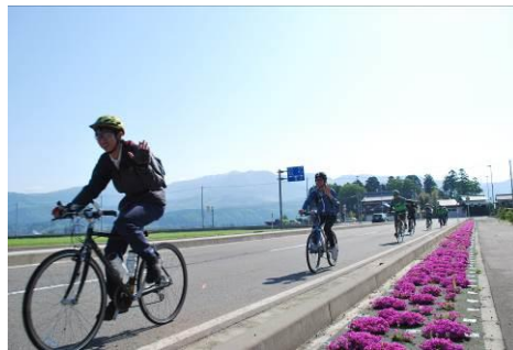
サイクリングイベント「自転車の日ライド」

駅に近い県立施設や郊外の施設では、駐車場の一部をパーク&ライド・サイクルライド駐車場として提供し、クルマと公共交通機関や自転車を組み合わせて利用しやすい環境作りを推進してきました。