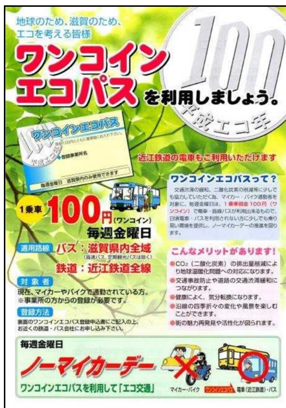
長浜市役所本庁による「公共交通の情報を提供」するためのメール配付資料 「ワンコインエコパス」チラシ(滋賀県・滋賀県バス協会作成)