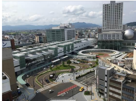
様々な交通機関が結節した福井駅西口広場

2023年春には北陸新幹線敦賀開業を控え、県外からさらに多くのお客様をお迎えすることになり、公共交通機関の役割はますます重要なものとなります。