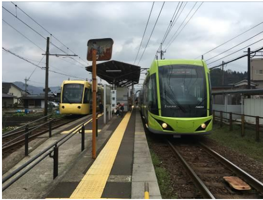
えちぜん鉄道と福井鉄道の相互乗り入れ