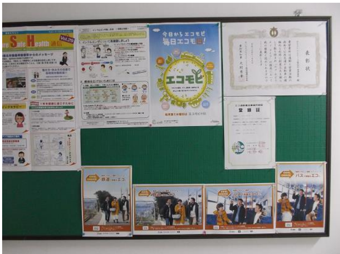
NTTコム マーケティング株式会社 東海営業所の社員に周知するために 社内掲示板に掲示しているニュース・トピックス・ポスターなど

なお、既に認証・登録済みの事業所のうち、「エコ通勤取り組み事例紹介」のご提出があった事業所、あるいは本メールマガジンで取り組み内容の概要をご紹介し承認の得られた事業所は、以下のページでご紹介しております。取り組みの参考情報として是非ご覧ください。